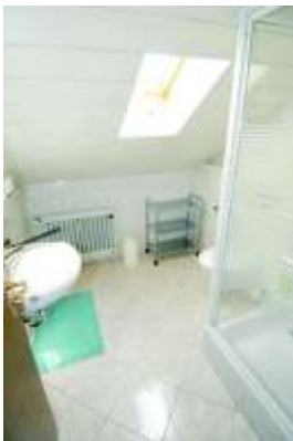
Dusch mit WC

komplett eingerichtete Wohnküche mit Kühl- Gefrierschrank sowie Essecke