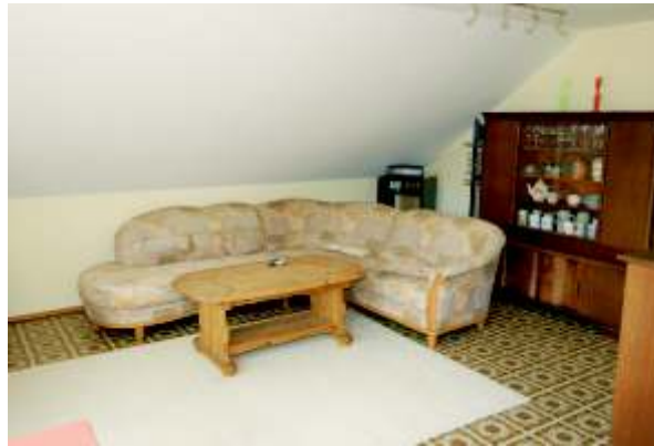
Der gemütlich eingerichtete Wohn- und Aufenthaltsbereich